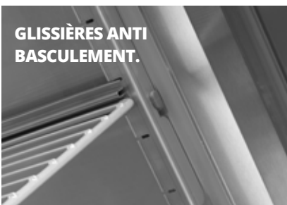
GLISSIÈRES ANTI BASCULEMENT.