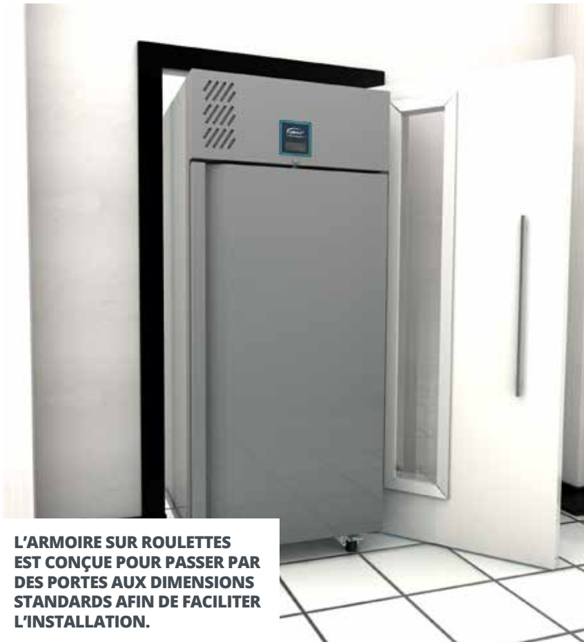
L'ARMOIRE SUR ROULETTES EST CONÇUE POUR PASSER PAR DES PORTES AUX DIMENSIONS STANDARDS AFIN DE FACILITER L'INSTALLATION.