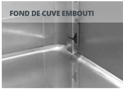
FOND DE CUVE EMBOUTI