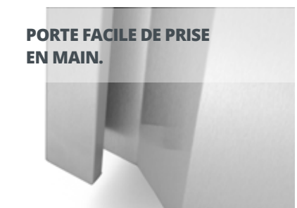
PORTE FACILE DE PRISE EN MAIN.