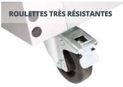
ROULETTES TRÈS RÉSISTANTES