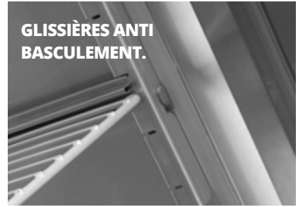
GLISSIÈRES ANTI BASCULEMENT.